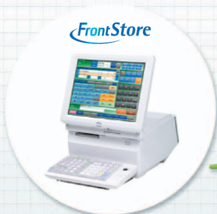
POSシステム FrontStore 富士通フロンテック株式会社製

ギフトショップ専用システムPOS LiSは、FrontStoreとリアルタイムに連携し、ギフトショップには欠かせない「売上用途によるお客様抽出（販促名簿管理）」「贈答品お届け先管理（贈答先管理）」「月締め請求書発行（売掛請求管理）」「専用伝票・宅配伝票発行（カスタム印刷）」などの業務をサポートします。